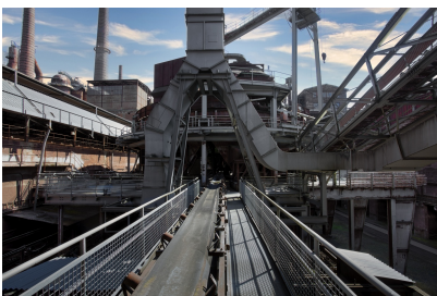
Entdeckerweg über den Sinterrundkühler und die Sinterentstaubung