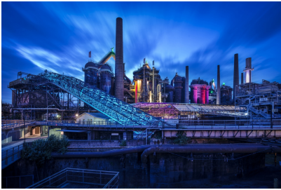
Die Völklinger Hütte zur blauen Stunde