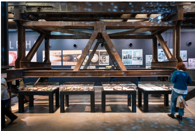
Ausstellungsansicht, JENS HARDER. THE STORY OF PLANET A