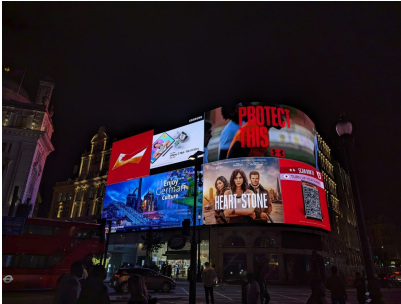
Die beleuchtete Hochofengruppe der Völklinger Hütte am Londoner Piccadilly Circus: Enjoy German Culture!